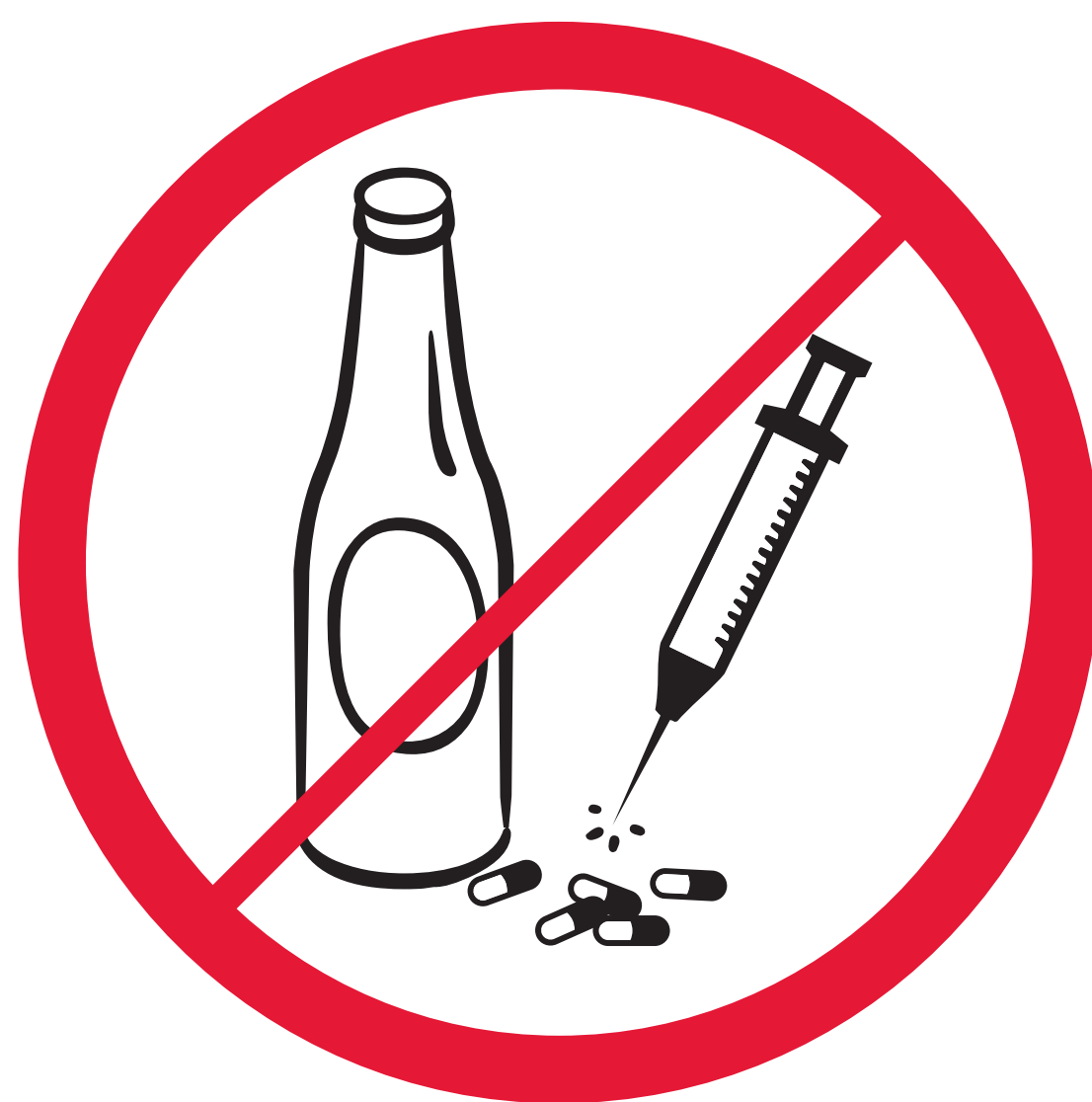
Boissons alcooliques, drogues Alcohol, drugs