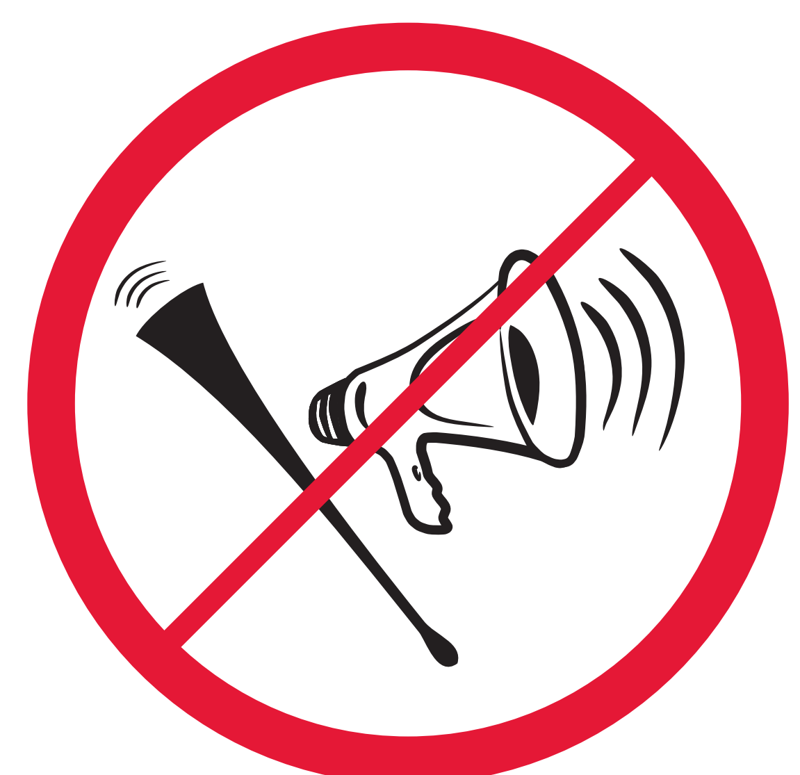
Instruments mécaniques ou électroniques, mégaphones, vuvuzelas Mechanical or electronic noise making device devices, megaphones, vuvuzelas