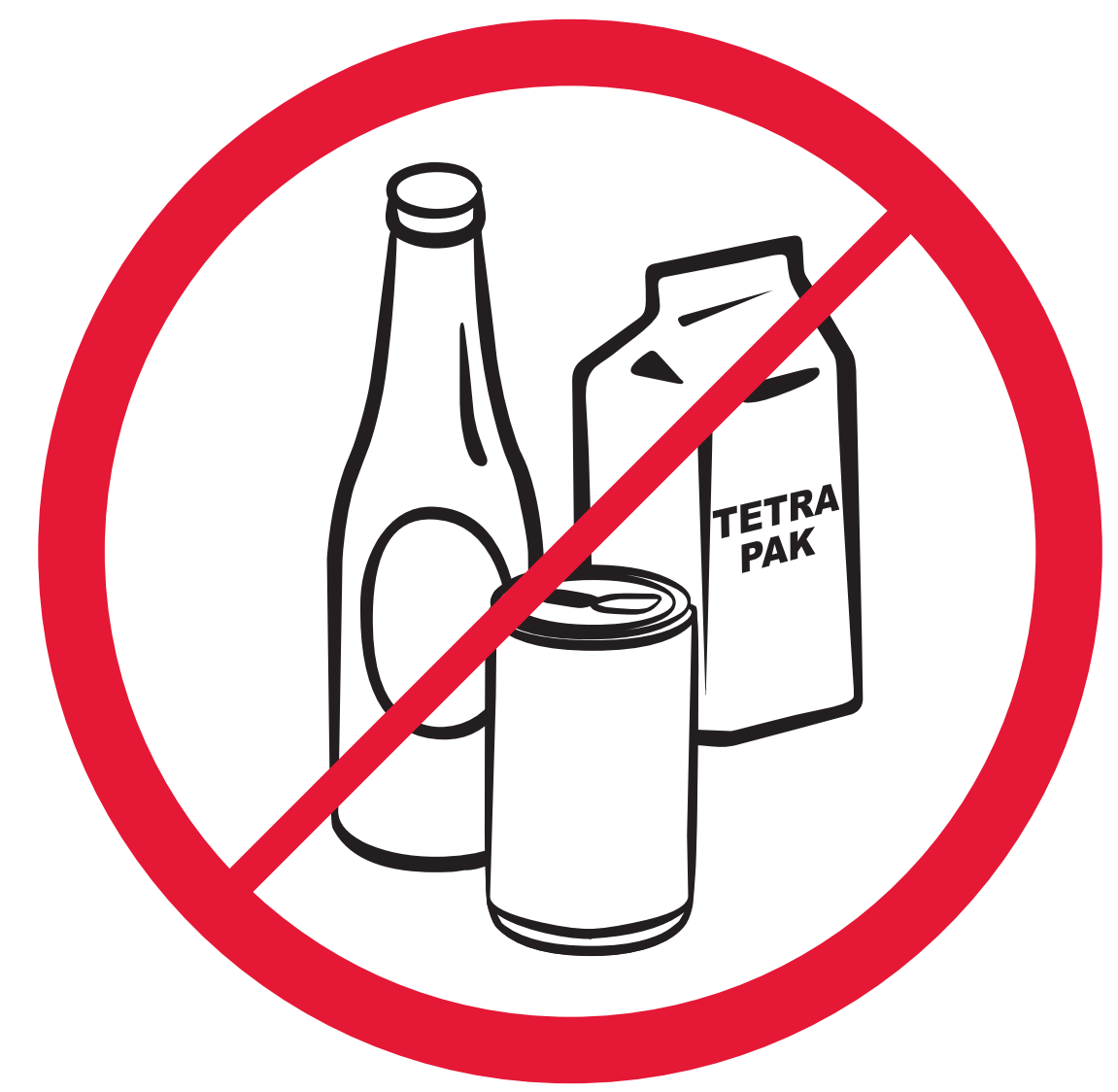
Bouteilles, cannettes, objets en PET et en verre Bottles & glassware made from PET & glass