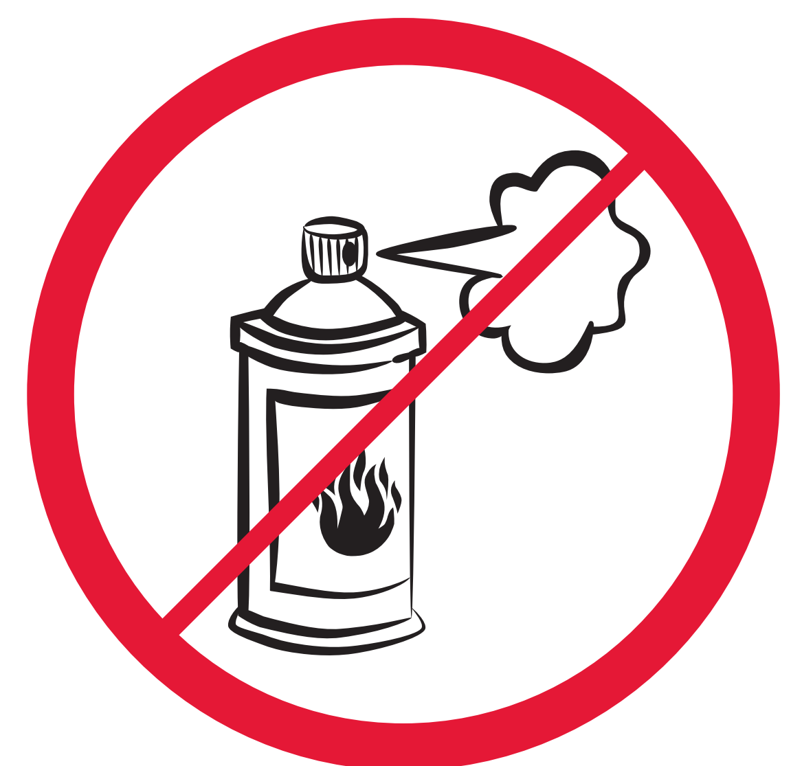
Sprays au gaz ou inflammables Aerosol sprays