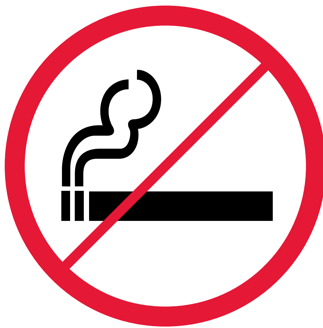
Défense de fumer No smoking