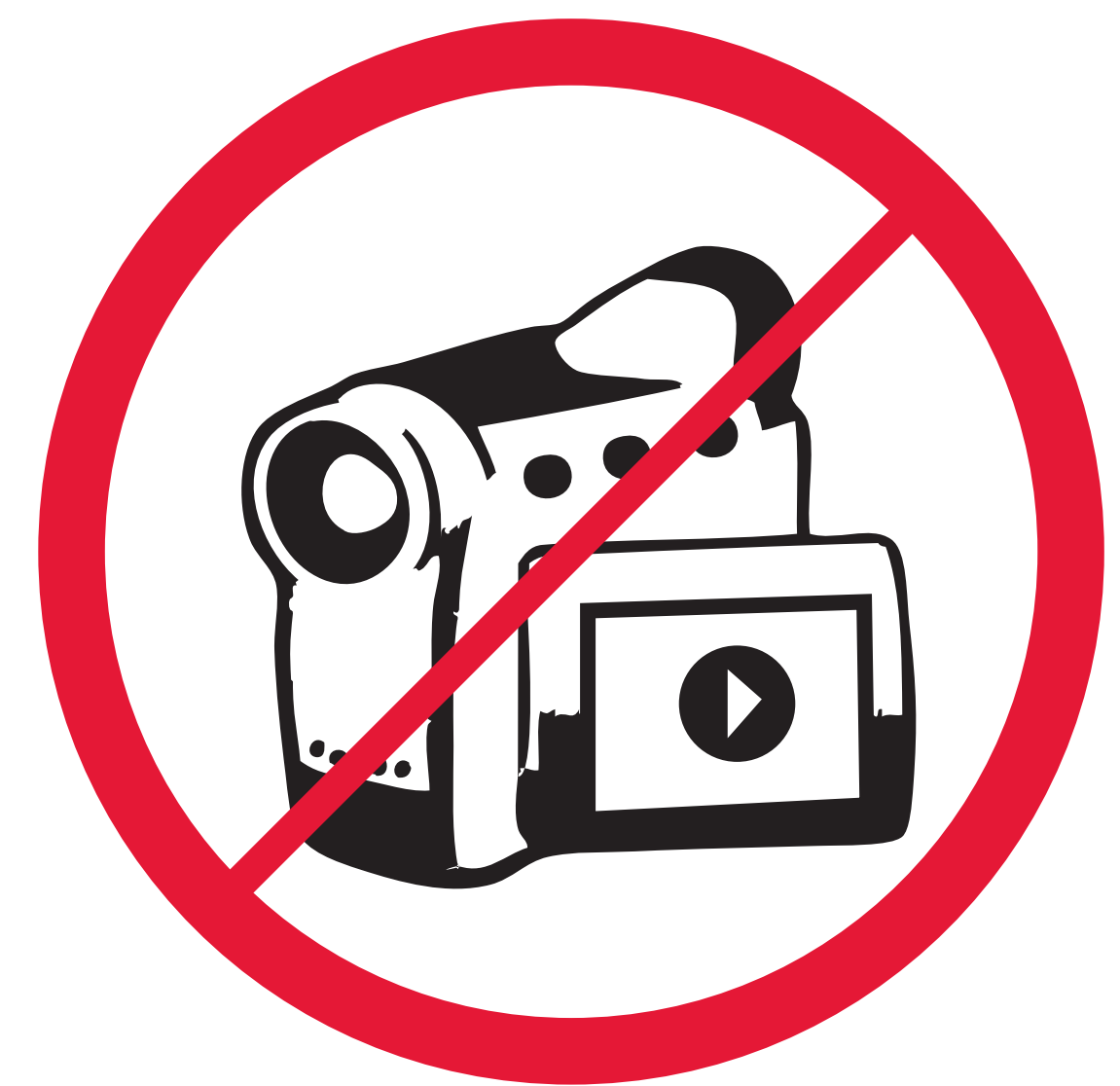
Appareils photo et caméras vidéo professionnels Professional cameras & video cameras