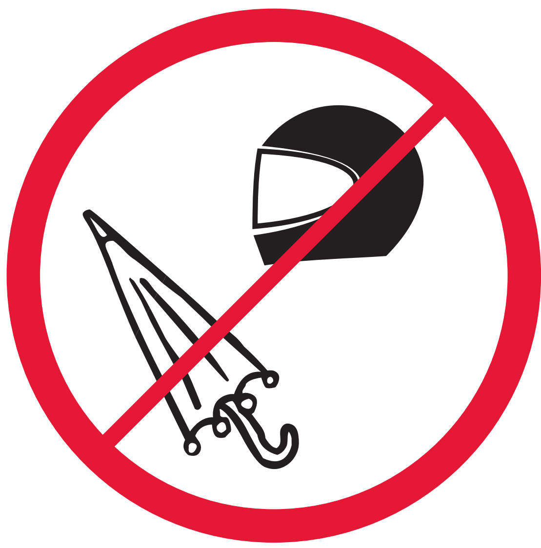
Parapluies et casques Umbrellas and helmets

CHAQUE SPECTATEUR PEUT ÊTRE FOUILLÉ À SON ENTRÉE DANS LE STADE PAR LA SÉCURITÉ