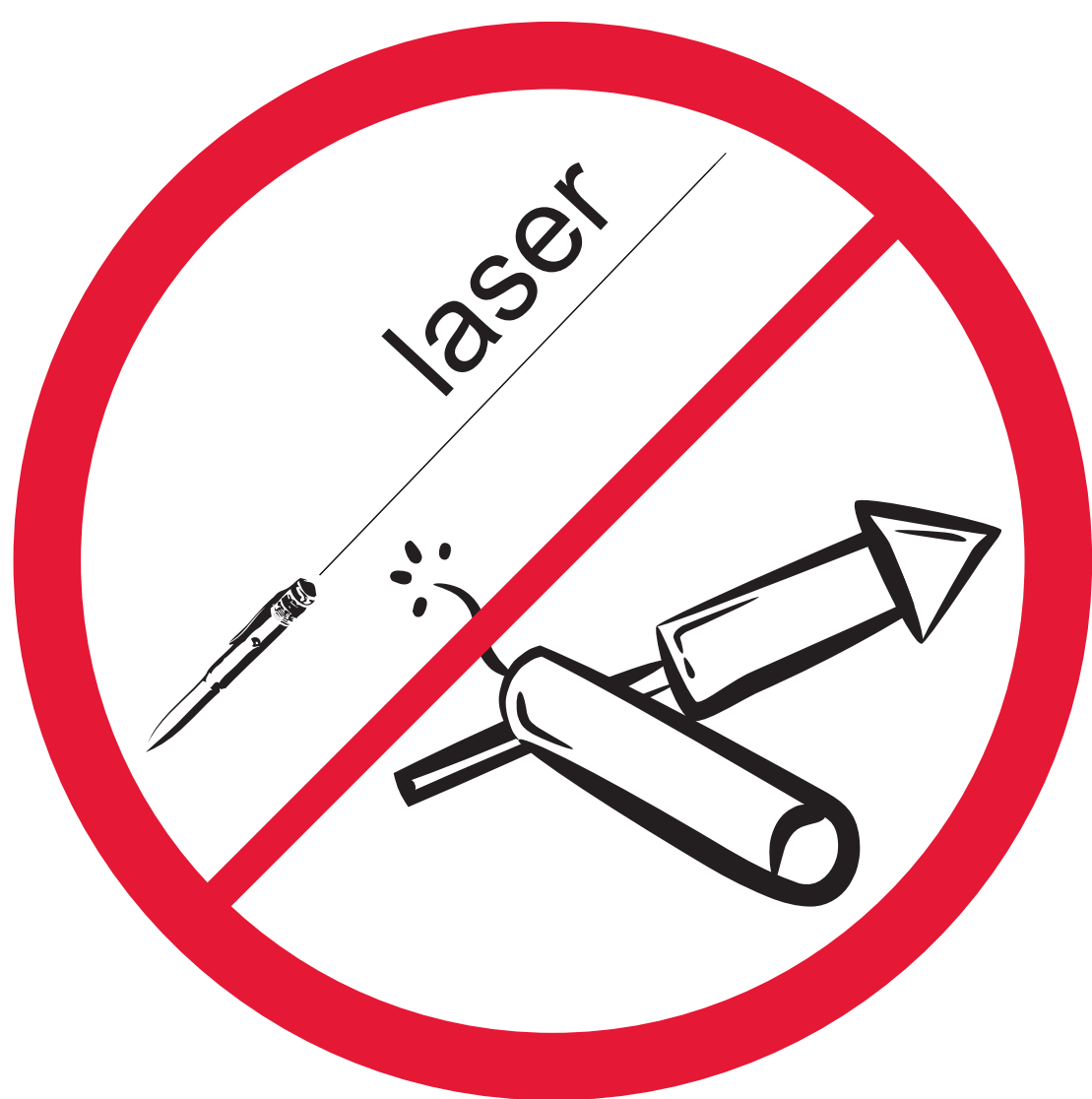
Feux d'artifices et pointeur laser Pyrotechnics & laser pointers