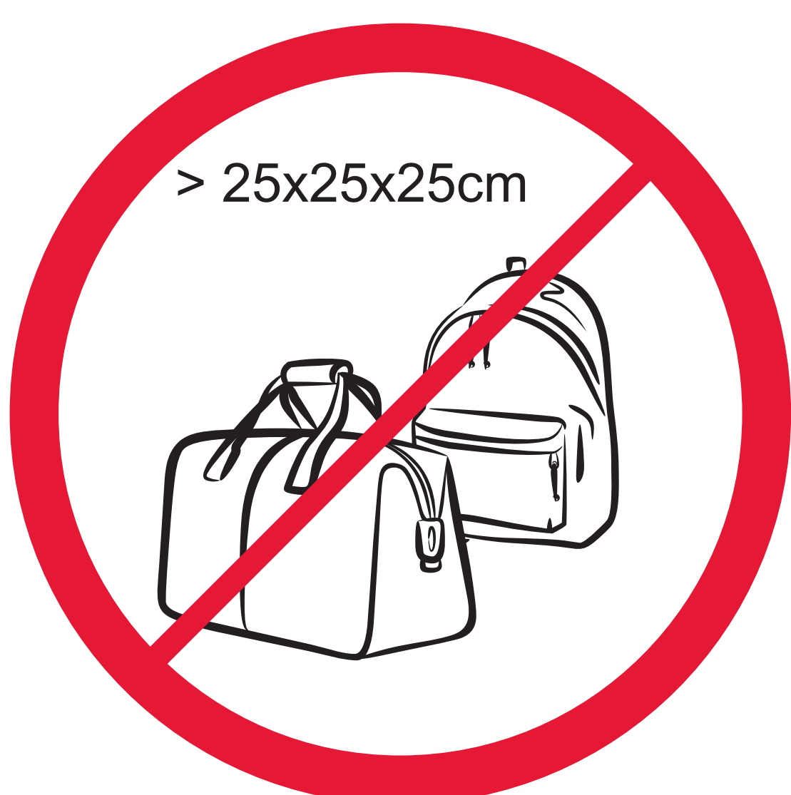
Valises, sacs et objets encombrants > 25 x 25 x 25 cm Unwieldy items, large bags > 25 x 25 x 25 cm