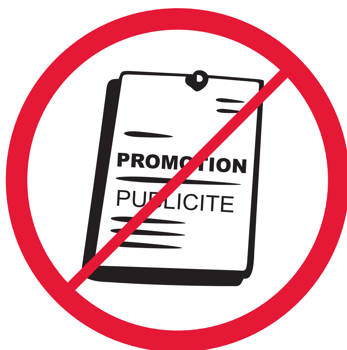
Matériel et habits promotionnels ou commerciaux Promotional or commercial materials or clothing