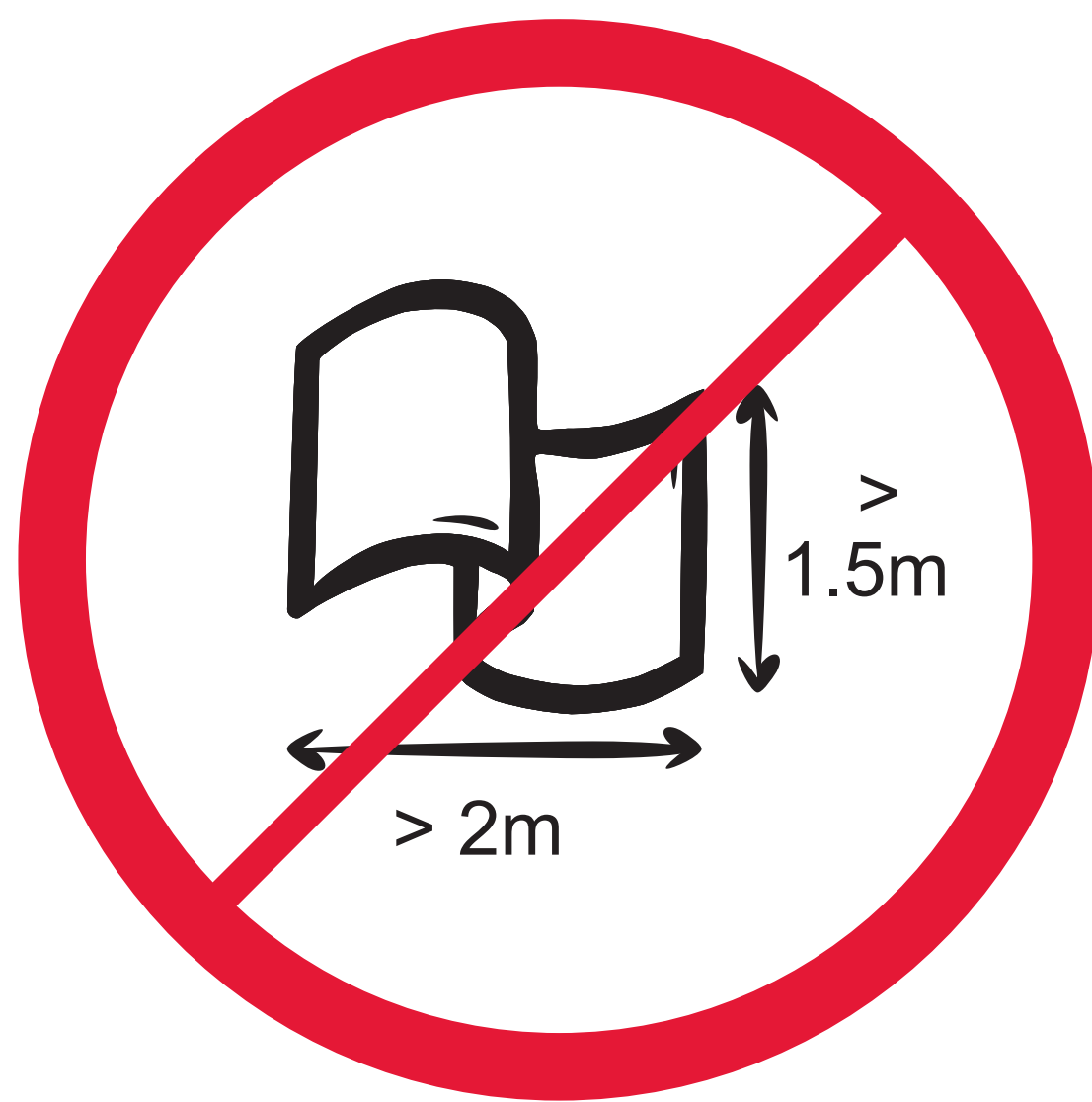
Bannières ou drapeaux > 2.0 m x 1.5 m Banner & Flags > 2.0 m x 1.5 m (6.5' x 5.0')