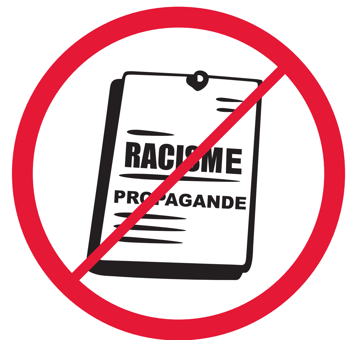
Matériaux racistes, xénophobes, politiques religieux et de propagande Racist, xenophobic, political, religious & propaganda materials