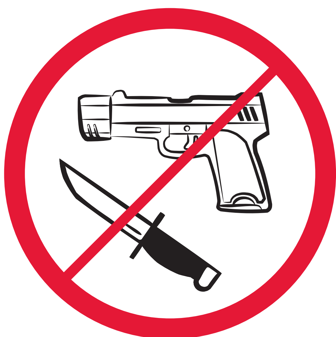
Armes à feu, explosifs, armes blanches, et tout ce qui peut être utilisé comme une arme Weapons, explosives, knives & anything that could be used as a weapon